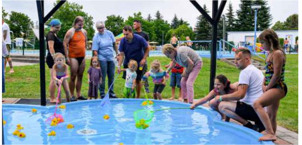
Der Pool mit den kleinen Enten war eine besondere Attraktion für die jungen Besucher des Schwimmbadfestes im Zuckerdorf.