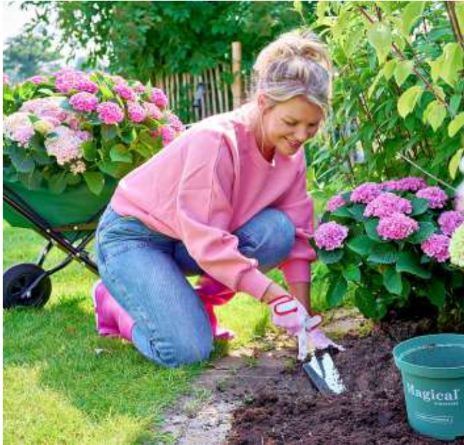
Gepflanzt werden können die starken Hortensien aus dem Topf fast das ganze Jahr - auch jetzt im Sommer.

Die Farbpalette von Hortensien ist vielfältig und hat für jeden Geschmack und Gartenstil etwas zu bieten. Von reinem Weiß und intensiven Grün über ein helles Rosa und zartes Blau bis hin zu einem satten Lila, tiefen Weinrot und