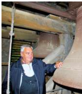
Glöckner von St. Petri