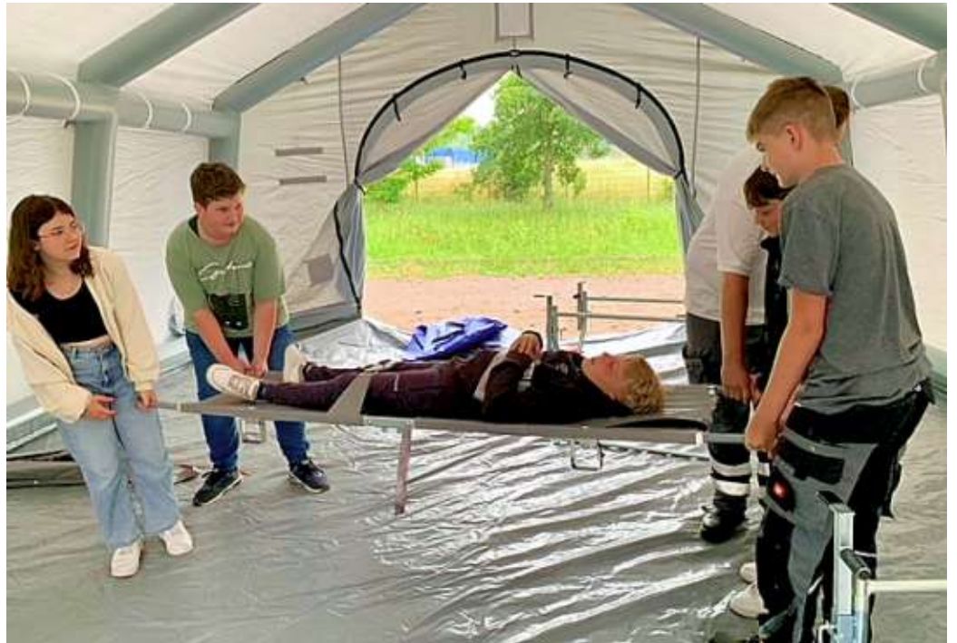
Die Schüler üben die praktische Anwendung der Tragehilfe.