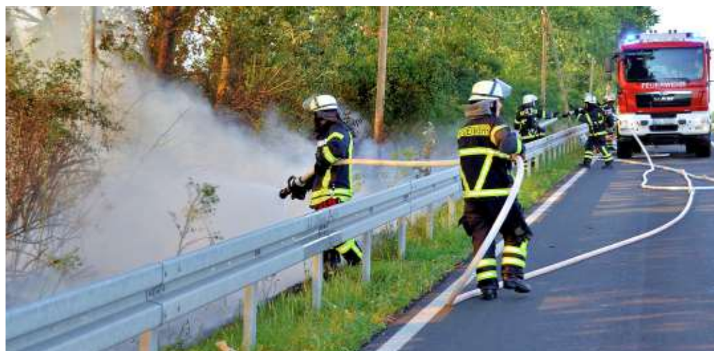
31 Brandschützer waren auf der B246 im Einsatz und bekämpften erfolgreich einen Vegetationsbrand.