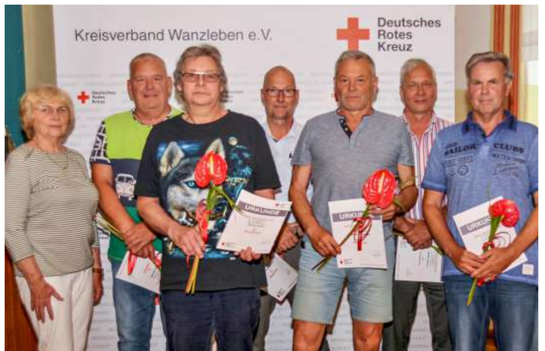
Die fleißigen Blutspender kommen aus dem gesamten Gebiet des Kreisverbands Wanzleben. Etliche von ihnen haben schon über 100 mal gespendet.