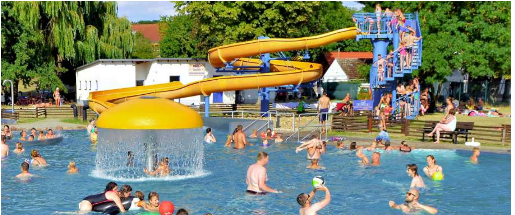
Das Spaßbad in Wanzleben ist ein beliebter Ort für alle, die Abkühlung im Wasser suchen.