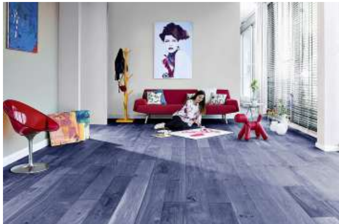
Parkett mal ganz anders: Hier ist der Bodenbelag in einem Blau-Violett-Ton gehalten.

Die genannten Behandlungen heben meist den natürlichen Holzton des Parketts hervor. Aber warum nicht einmal von gewohnten Pfaden abweichen und Farbe ins Spiel bringen? Bei Möbeln und Wandpaneelen aus Holz greift man gerne mal zum Farbeimer und Pinsel. Auch bei anderen Bodenbelägen wie Fliesen oder Naturstein ist mehr Mut im Spiel. Bunt geht auch mit Parkett. Natürlich auch mit neu verlegtem. Es gibt zwei Arten, Parkett mit Farbe zu behandeln. Zum einen kann man den Boden färben, sodass die Holzmaserung erkennbar bleibt. Durch das Abschleifen oder durch spezielle Bürsten lässt sich zunächst die Maserung beto-