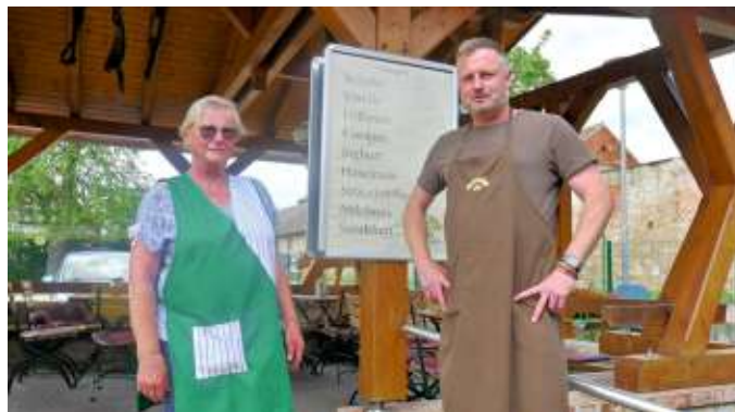
Seit über 40 Jahre eiskalte Köstlichkeiten