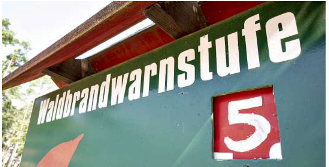
Im nördlichen Landkreis Börde gilt bereits die Waldbrandwarnstufe 5, im südlichen Teil die Warnstufe 4.

Durch umsichtiges Verhalten könnten viele Brände verhindert werden, werden sie doch häufig durch Fahrlässigkeit und Unachtsamkeit verursacht, so der Landkreis. Leichtfertig weggeworfene Zigaretten, vergessene Glasflaschen, die wie ein Brennglas wirken, oder ein nicht sachgemäß gelöschtes Grillfeuer könnten schnell verheerende Auswirkungen haben. Auch sehr heiße Katalysatoren von