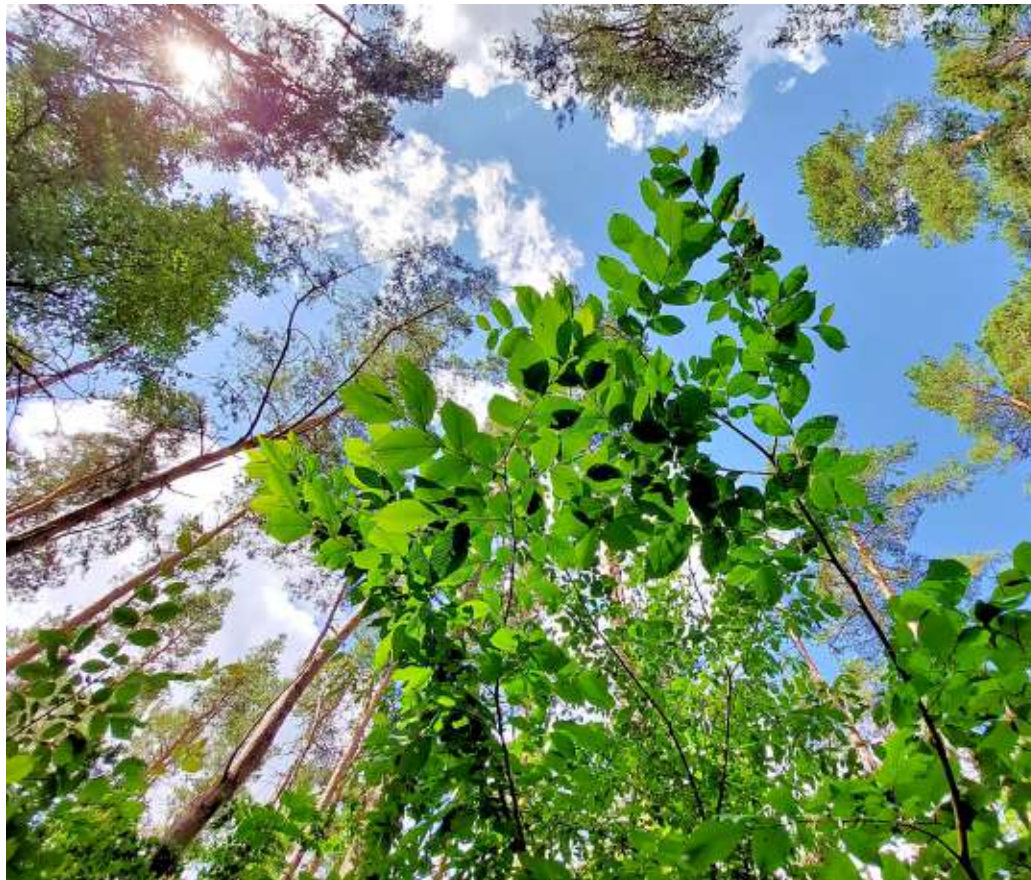
Die Buche, hier ein noch junges Exemplar, kommt in den heimischen Wäldern oft vor. Inzwischen macht aber auch ihr die Trockenheit zu schaffen.

Zu diesen Einzelfällen gehören etwa das Erholungs- und Landschaftsschutzgebiet Hohes Holz. Das 1500 Hektar große Waldgebiet nördlich von Oschersleben habe demnach eine kalkreiche Erde und verfüge zudem