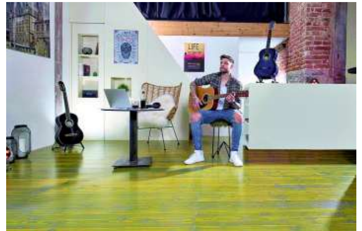
Vorteil von festgeklebten Parkettböden: Der Holzbelag abschleifen und wieder neu aufbereiten.

Immer mehr Bauherren und Renovierer beschäftigen sich mit dem Thema Parkett und Farbe. Beliebt sind zurzeit helle Töne wie Lichtgrau oder kräftige Blautöne. Auch weiß eingefärbte Dielen sind beliebt. Überhaupt wird die Holzstruktur tendenziell eher sichtbar gelassen. Die genannten Farben bilden einen klaren Kontrast zur natürlichen braun-rötlichen Optik des naturbelassenen Holzes. Voraussetzung für die wie-