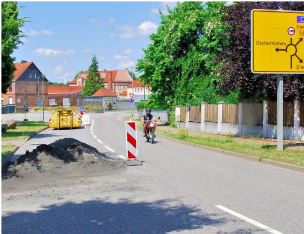
Die Sanierung der B 246a von Seehausen aus in Richtung Remkersleben läuft bereits seit einer Woche. Von der Seestadt aus kann die Strecke bis zum Gewerbegebiet befahren werden.

Zufahrt zum Gewerbegebiet der Seestadt ist für Anlieger und Lieferverkehr erlaubt