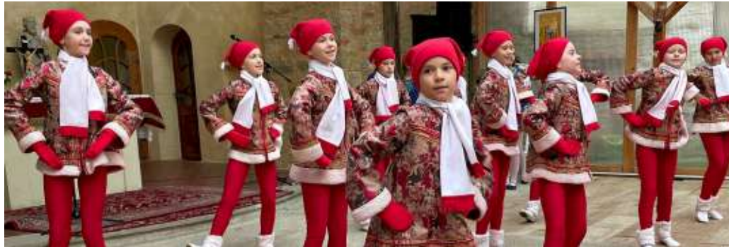
Die Gruppe „Skawisch“ aus Minsk sorgten in der Domersleber Kirche für Begeisterungstürme