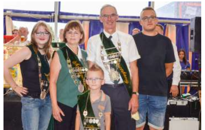
Die diesjährigen Schützenkönige beim Volks- und Schützenfest in Hordorf.

stand dann ein Frühshoppen mit den Schermcker Blasmusikanten und einem Zusammenspiel des Hordorfer und Oschersleber Spielmannszuges im Festzelt auf dem Programm. Neben den anschließenden weiteren Aktionen für Kinder wurde das Schützenfest in Hordorf mit einer gemütlichen Kaffee- und Kuchenrunde, organisiert von den Hordorfer Kuchenfeen, beendet.