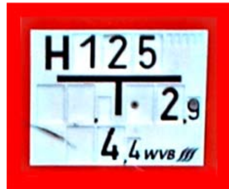
Hinweisschilder zum Auffinden von Hydranten

Für Ihre Unterstützung danken das Ordnungsamt und die fleißigen Kameraden der Freiwilligen Feuerwehren.