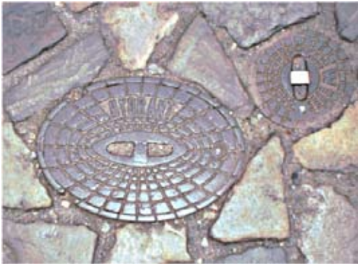
Unterflurhydrant (ovaler Deckel mit Aufschrift Hydrant )

Da es in den meisten Gemeinden nur Hydranten unter der Erde gibt, sind diese natürlich nicht so leicht zu finden. Um Ihnen einmal zu zeigen wie solche Hydranten aussehen und wie man sie findet, sind die nachstehenden Bilder eine Hilfe.