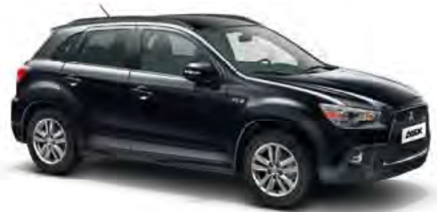
Abb.: ASX Instyle