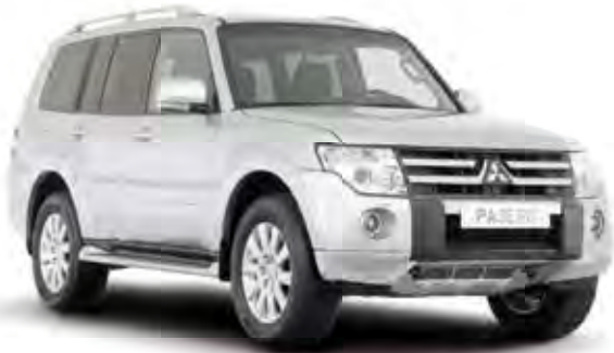
Pajero 5-Türer Instyle