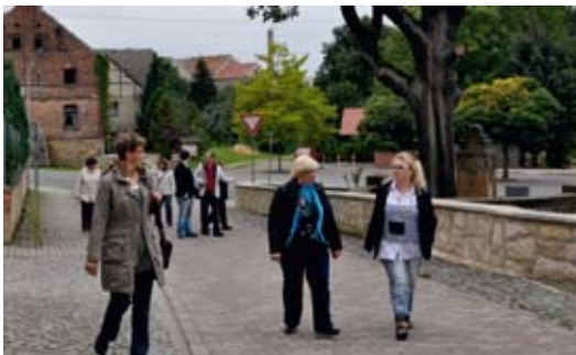
Akteure aus der LAG „Bördeland“ informierten sich über den Stand der Umsetzung der Leader-Projekte

Für die Lokale Aktionsgruppe (LAG) „Bördeland“ wurden bis zum 1. November 2011 insgesamt 24 Projekte bewilligt, die mit rund 1 Million Euro von der Europäischen Union kofinanziert werden. Zusätzlich beteiligten sich das Land Sachsen-Anhalt und die Bundesrepublik mit weiteren je 28.000 Euro bzw. 5.000 Euro. Dass derzeit noch mächtig gebaut und entwickelt wird, zeigt der im Gegensatz zum bewilligten Budget noch geringe Auszahlungsstand, der derzeit bei etwa 250.000 Euro liegt und sechs der 24 bewilligten Projekte umfasst. Ursache ist hierfür auch das bei Leader angewandte Vorfinanzierungsprinzip.