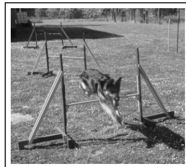
Lexa beim Überspringen einer Hürde

Zwischen Weihnachten und Neujahr legen wir für unsere Hunde eine Trainingspause ein. Im Jahr 2013 findet das letzte Training am 21.12.2013 statt. Am 04.01.2014 beginnen wir wieder mit den Übungsstunden.