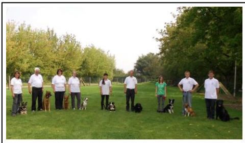
Die Teilnehmer an der Begleithundeprüfung

Vielen Dank an alle Helfer für die hervorragende Organisation. Ein besonderer Dank geht an den Richter, der mit seinem geschulten Blick die Prüfungsergebnisse jedem konstruktiv und motivierend erläutert hat.