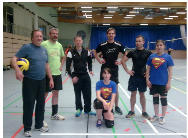
PSV-Team beim Mitternachtsturnier in Haldensleben „Ohrelandhalle“