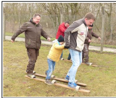
Die Sportfreunde im Wettkampf beim Tandemskilauf