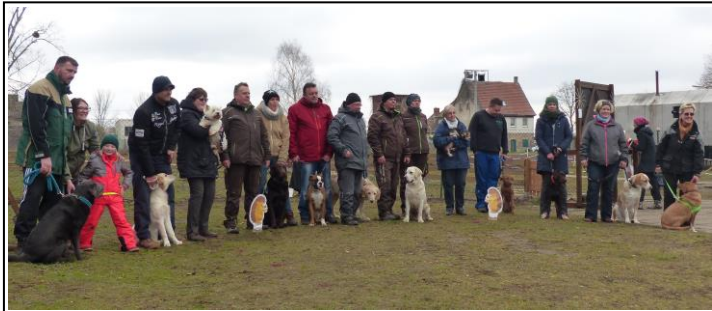
Die Teilnehmer an den Osterspielen