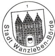
Thomas Kluge Bürgermeister